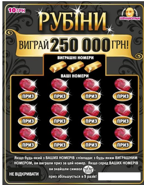
Лицьова сторона лотерейного білета