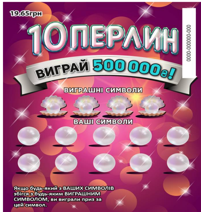
Лицьова сторона лотерейного білета