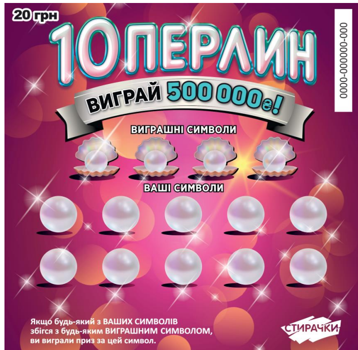
Лицьова сторона лотерейного білета