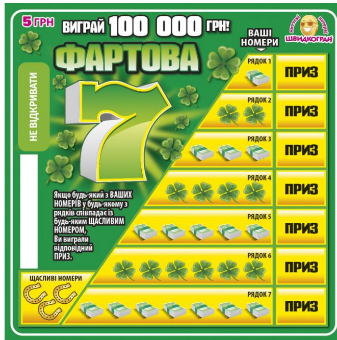
Лицьова сторона лотерейного білета